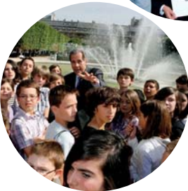
Conseil constitutionnel, 25 juin 2010