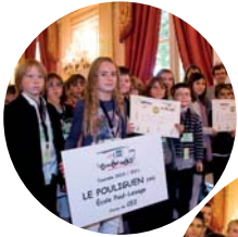
Assemblée nationale, 23 juin 2011

Depuis 6 ans, le Sénat, l'Élysée, le Conseil constitutionnel et l'Assemblée nationale ont plusieurs fois accueilli la « Fête des mots ».